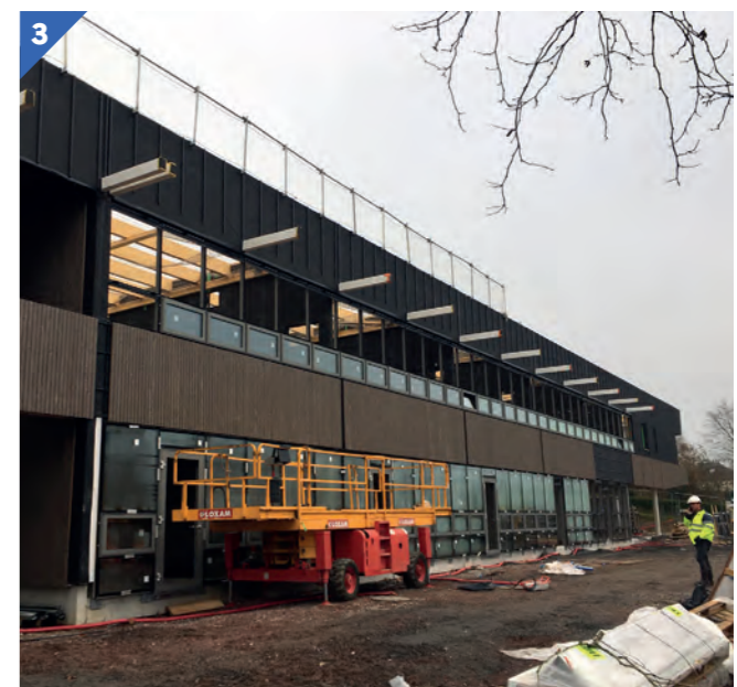
Projet de rénovation né du Schéma Directeur Immobilier de SAINT-LÔ.

En revanche, dès qu'on a pu sortir les résultats individuels -les fiches par bâtiment- tout a changé. C'est devenu un outil très demandé par les services pour établir des cahiers des charges par exemple... une base d'analyse très utile au quotidien. Développer une communication plus marquée sur les bénéfices et l'apport d'une telle démarche peut renforcer l'adhésion interne. "